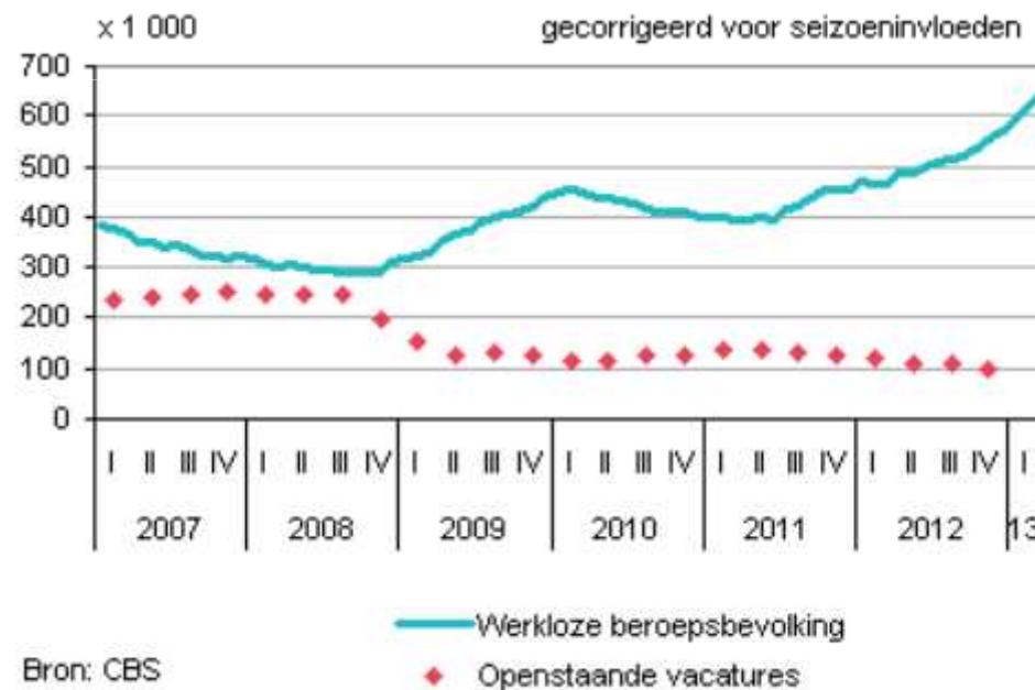
Vacatures en werkloosheid